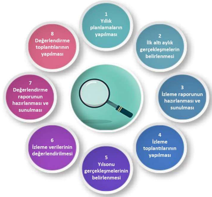
Şekil-4 İzleme ve Değerlendirme Süreci

İzleme ve değerlendirme sürecinin işleyişi ana hatları ile yukarıdaki şekilde özetlenmiştir. Okulumuz Stratejik Planı izleme ve değerlendirme çalışmalarında 5 yıllık Stratejik Planın izlenmesi ve 1 yıllık gelişim planının izlenmesi olarak ikili bir ayrıma gidilecektir. Stratejik planın izlenmesinde 6 aylık dönemlerde izleme yapılacak denetim birimleri, il ve ilçe millî eğitim müdürlüğü ve Bakanlık denetim ve kontrollerine hazır halde tutulacaktır.